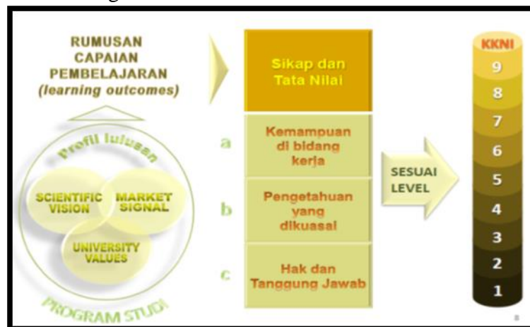
Gambar 1. Deskripsi Pengembangan KKNI

Sekarang dengan kita melihat berbagai kondisi dan beberapa hal yang sudah kita urai sebelumnya maka pertanyaan berikutnya bagaimanakah langkah pendidikan tinggi dalam menyikapi era ini. Sesuai dengan makna disrupsi sendiri, pendidikan tinggi berupaya untuk berinovasi sesuai dengan yang diharapkan untuk menghadapi perkembangan era ini. Kebijakan-kebijakan di pendidikan tinggi telah diarahkan menuju pengembangan Tri Dharma yang berbasis teknologi baik pendidikan, penelitian, dan pengabdian. Terkait dengan pendidikan, di pendidikan tinggi mengembangkan kurikulum yang berbasis KKNI dan SNPT. Kerangka Kualifikasi Nasional Indonesia (KKNI) merupakan kerangka penjenjangan kualifikasi kompetensi yang dapat menyandingkan, menyetarakan, dan mengintegrasikan antara bidang pendidikan dan bidang pelatihan kerja serta pengalaman kerja dalam rangka pemberian pengakuan kompetensi kerja sesuai dengan struktur pekerjaan di berbagai sektor. (Perpres No. 8 Tahun 2012) Kerangka Kualifikasi Nasional Indonesia (KKNI) bidang pendidikan tinggi merupakan kerangka penjenjangan kualifikasi yang dapat menyandingkan, menyetarakan, dan mengintegrasikan capaian pembelajaran dari jalur pendidikan nonformal, pendidikan informal, dan/atau pengalaman kerja ke dalam jenis dan jenjang pendidikan tinggi. (Permendikbud No. 73 tahun 2013). Deskripsi KKNI dapat dilihat dalam gambar berikut.